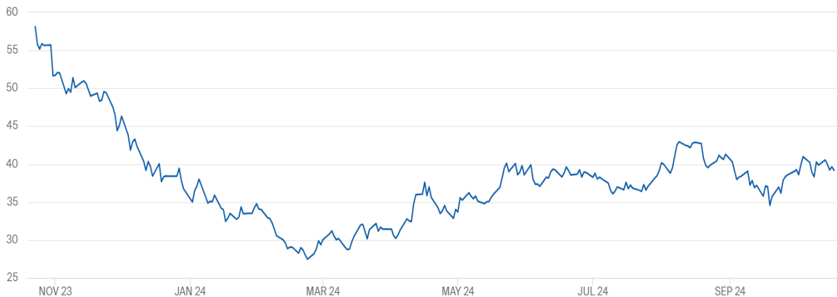
Földgáz TTF tőzsdei ár ( EUR/MWh )